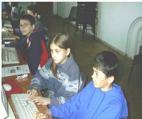
Copiii in timpul workshopurilor de informatica