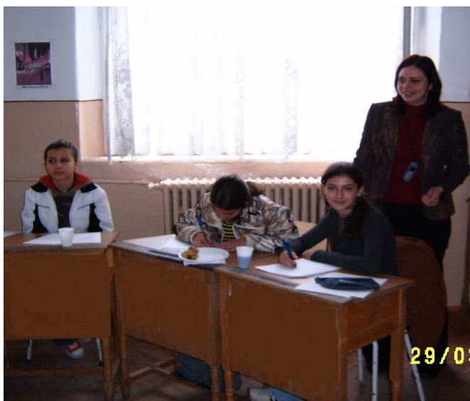
Workshopuri cu tinere intre 12-18 ani